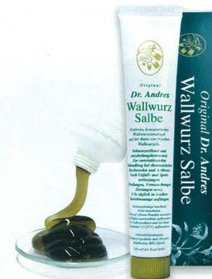
Neben der erwiesenen Wirksamkeit gegen Schmerzen hat die Dr. Andres Wallwurzsalbe weitere überzeugende Argumente. Die Salbe ist nämlich ein Gel, es zieht sofort ein, schmiert nicht und hinterlässt keine Flecken. Ausserdem ist es sehr gut hautverträglich und geruchlos.

Dank der sorgfältigen Zubereitung ist die Original Dr. Andres Wallwurzsalbe so erfolgreich. Schmerzen in Gelenken bei Rheuma, Arthritis und Arthrose, Sportverletzungen, Venenentzündungen, Krampfadern und Hämorrhoiden lassen sich wirksam behandeln.